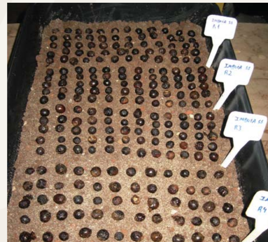
En este experimento, el tratamiento aplicado a las semillas del árbol de imbuia ( Ocotea porosa ) se repite cuatro veces para mejorar la fiabilidad de los resultados.

Finalmente, incluye controles dentro del experimento como un medio de verificación de que los efectos observados se deben en realidad a las diferencias entre tratamientos. Un lote de semillas de control no recibirá tratamiento alguno –para permitir la comparación de las tasas de germinación con lo que habría ocurrido de todos modos.