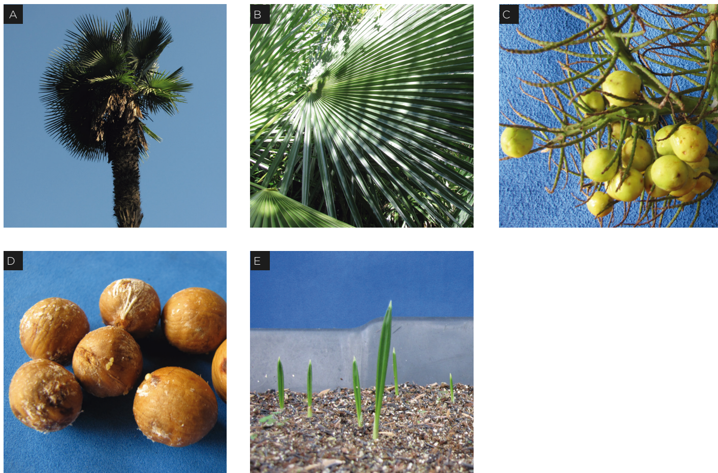
Figura 1: A - Indivíduo adulto; B - Folhas; C - Frutos; D - Sementes; E - Plântulas.

Cuidados com a espécie: não há necessidade.