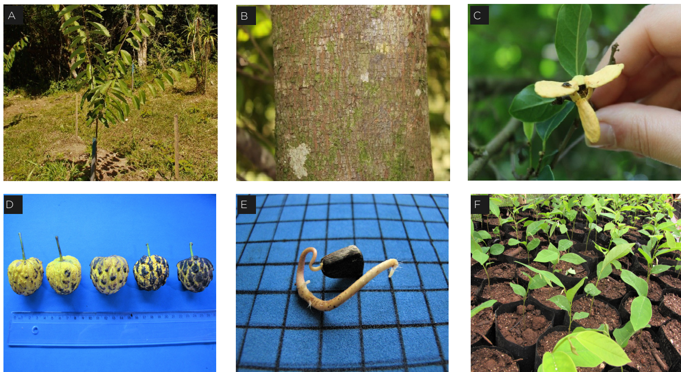
Figura 1: A - Indivíduo jovem; B - Fuste; C - Flor; D - Frutos; E - Semente em germinação; F - Plântulas.

Cuidados com a espécie: recomenda-se cuidado extra durante a repicagem para não danificar as raízes, evitando-se entrada de patógenos.